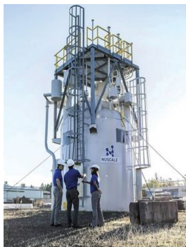
Petit mais factice : un réacteur du projet NuScale de 77 MW

On entend par SMR (petit réacteur nucléaire modulaire) des réacteurs nucléaires de 10 à 300 MW, soit au maximum le tiers d'un réacteur « classique ». D'après leurs promoteurs, ils sont souvent conçus pour pouvoir être construits en série en usine pour réduire les coûts et la complexité et seraient disséminés un peu partout sur les territoires ou à proximité d'usines gourmandes en électricité ou en chaleur. Ils permettraient surtout de faire accepter le risque nucléaire à une plus grande part de la population : les riverain·es sont souvent les moins enclin·es à critiquer la dangerosité du nucléaire afin de se protéger psychologiquement par le déni d'une peur quotidienne de l'accident. Selon