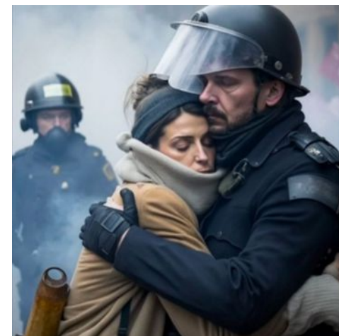
Exemple d'hallucination : ce CRS à six doigts généré par IA pendant les manif retraite de 2023 est le fruit d'une requête pour nous faire croire que tout le monde ne déteste pas la Police.