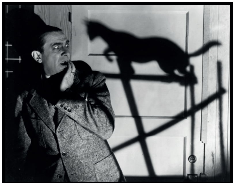
Travailliste effrayé par la seule ombre d'un jeune félin anti-travail

La question du chômage et des minimas sociaux n'est pas le seul domaine où s'illustre progressivement l'intensification de la mise au travail. L'Ecole pousse de plus en plus tôt les jeunes vers l'exploitation, sous forme des stages (travail gratuit bien bénéfique pour les patrons) ou par la question omniprésente de l'insertion professionnelle (Borne nous apprend même que les enfants devraient préparer dès la maternelle leur projet professionnel – malheureusement, entre pirate, aventurière ou magicien, les débouchés sur le marché actuel semblent pourtant réduits...)