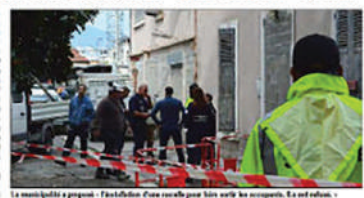
La municipalité a proposé l'expulsion d'une famille pour faire valoir les occupants. Et est refusé.

hier, la maison était à louer. Mais les occupants ont refusé de quitter la maison. Les occupants ont refusé de quitter la maison et ont déclaré qu'ils étaient des réfugiés. La mairie a demandé aux occupants de quitter la maison et de se rendre au centre de rétention administrative. Les occupants ont refusé et ont déclaré qu'ils étaient des réfugiés. La mairie a demandé aux occupants de quitter la maison et de se rendre au centre de rétention administrative. Les occupants ont refusé et ont déclaré qu'ils étaient des réfugiés.